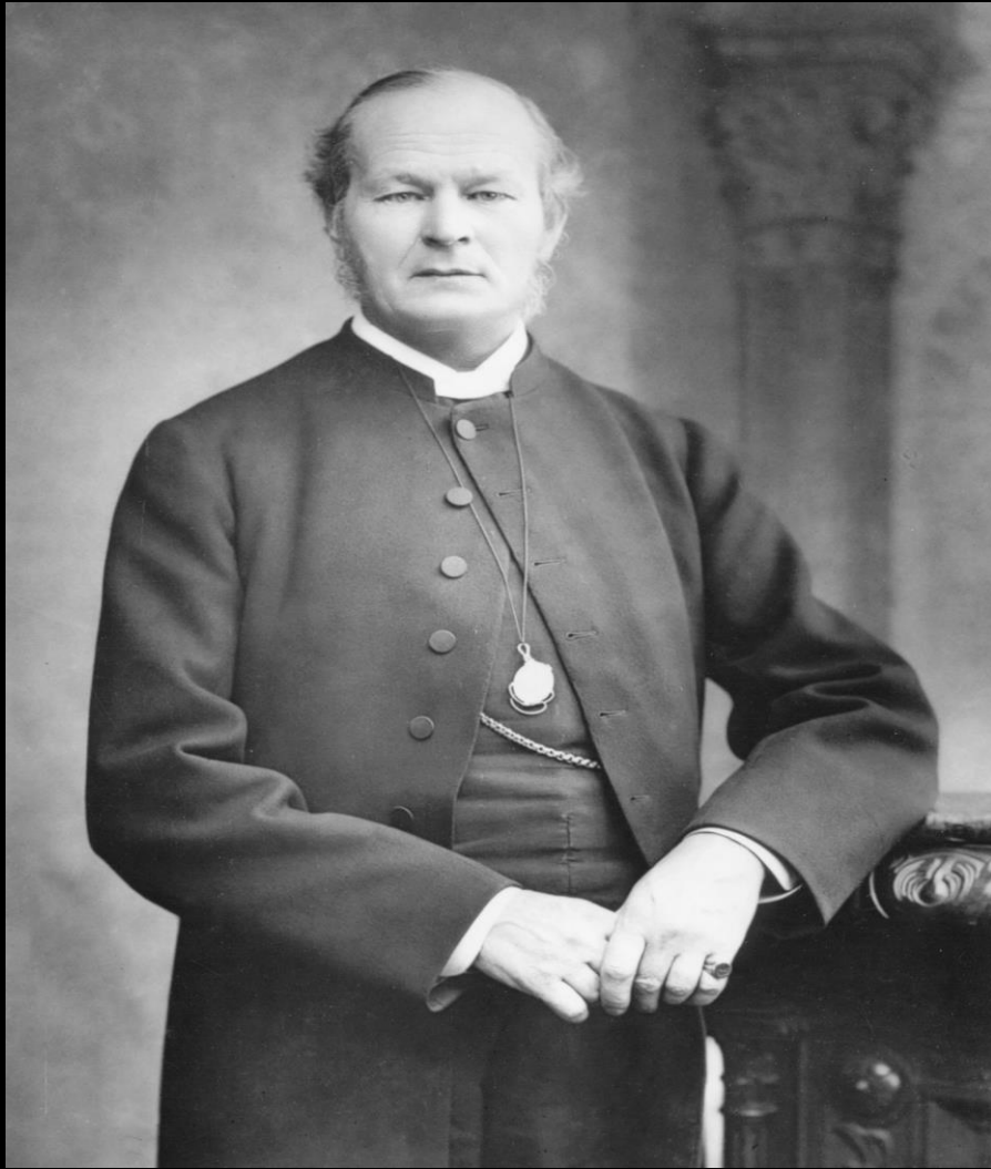
F. W. Farar 1831-1903

“以弗所書是在保羅對外幫人所傳的福音之中最高超、意義最深長、最有力以及最篤定的教導。”